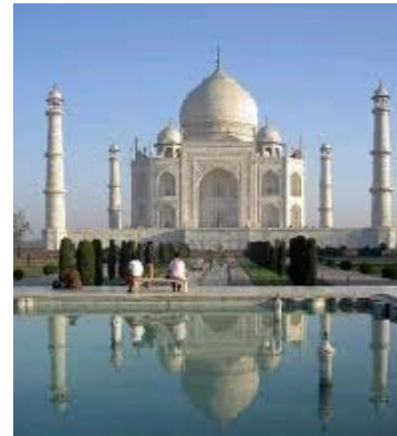
(Fotografía del Taj Mahal India)

En la representación de lo grotesco nunca se podrá vislumbrar el destello de belleza, es la realidad enaltecida por el arte, la obra tiene valor estético no por lo que representa sino por la fidelidad del artista en su obra grotesca.