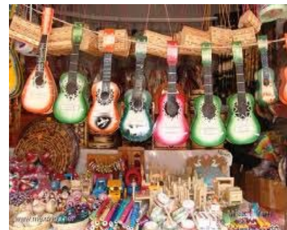
(Artesanías tradicionales de la República mexicana)

Los valores de asociación transmiten en su obra, pensamientos, opiniones e ideas ajenos a los valores estéticos, estimulan emociones e ideas relacionadas a la sociedad. Los valores utilitarios, son el aspecto práctico de la obra, consisten en la inteligencia práctica incluso a la comercialización de la obra.